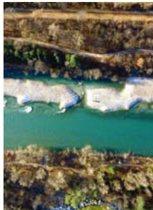
▽ Quattro fasi di una rivitalizzazione del fiume Lavaggio a Mendrisio/Rancate (2005)

Nel corso degli anni, numerosi corsi d'acqua sono stati arginati e coperti. Ciò ha provocato un'importante frammentazione del reticolo ecologico cantonale e la diminuzione di habitat e rifugi idonei alla fauna e alla flora.