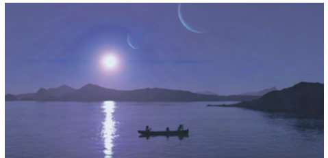
El botòn de nàcar