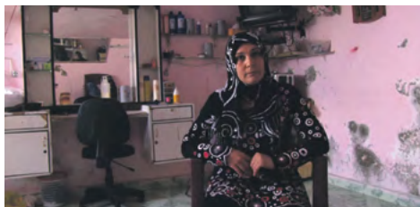
Syrie: instantanés d'une histoire en cours

Abounaddara è un collettivo anonimo di registi siriani: dal 2011, ogni venerdì, il collettivo posta un video su internet per offrire un ritratto della società siriana diverso da quello diffuso nei media. Il loro primo lungometraggio mostra dei frammenti di umanità raccontata dalle varie parti implicate nel conflitto: i ribelli, i pro-regime ma soprattutto i cittadini ordinari. In un mondo dominato da un flusso infinito d'immagini, la rappresentazione della sofferenza umana è soprattutto una scelta etica e politica.