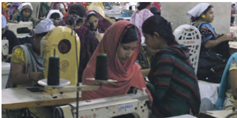
The True Cost

"The True Cost" is a groundbreaking film that pulls back the curtain on the untold story and asks us to consider, who really pays the price for our clothing? Filmed in countries all over the world and featuring interviews with leading influencers including Stella McCartney, Livia Firth and Vandana Shiva, "The True Cost" is an unprecedented project that invites us on an eye opening journey around the world and into the lives of the many people and places behind our clothes.