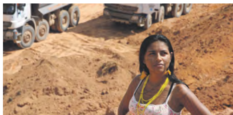
Dirty Gold War