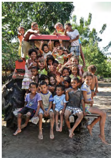
I contadini di Las Pavas, Colombia