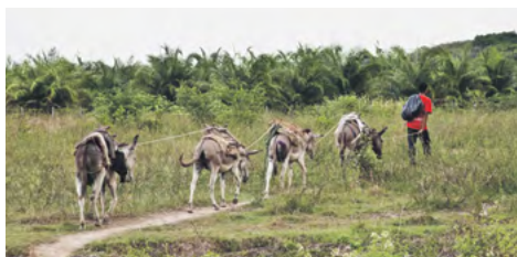
Algún día es mañana