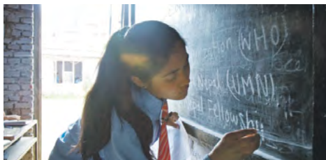
Drawing the Tiger